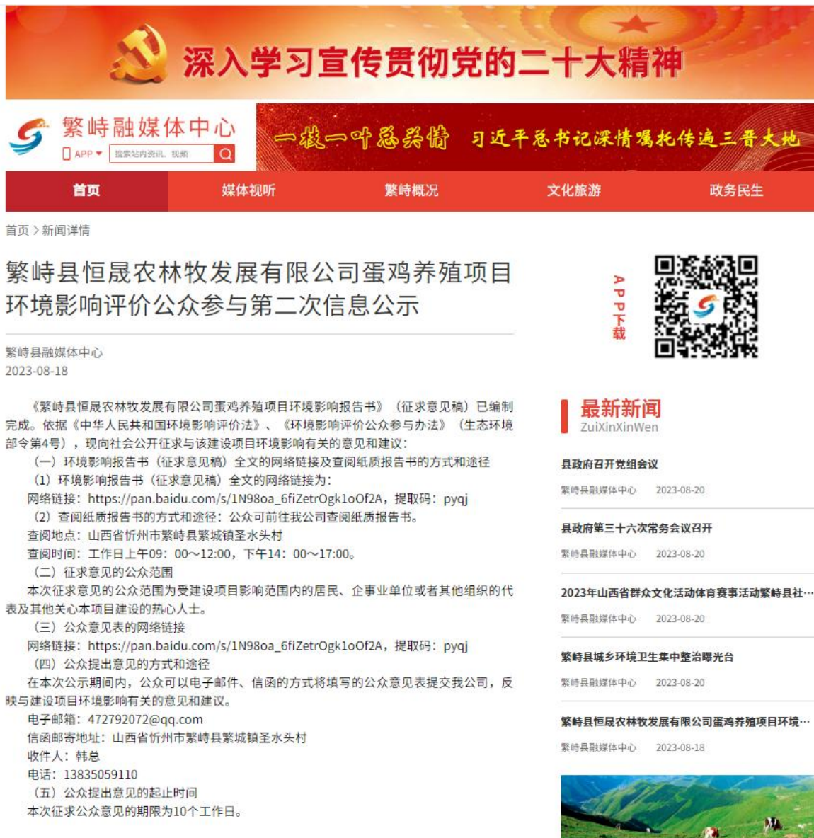
图 2 网上第二次公示

建设单位 2023 年 8 月 18 日在繁峙县融媒体中心网站上 ( https://www.fsxrmzx.com/#/details?infoId=34535 ) 进行了第二次公示，公告期限为 10 个工作日。网络公示情况见下图。