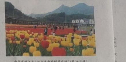
金华市浦江县210亩连片的鲜花农场(3月28日摄)。

大接待”架构已经建立。 “推动体系化，践行‘浦江经验’走向深入。” 浦江是县镇两级镇村和村宅镇去撤村，是紧邻的两个村。2020年，撤村建社区的砂石场在撤村的一块地，引发跨乡镇信访，双方矛盾不断升级。 此后，金华市人大常委会副主任、浦江县委书记等两级领导三次接访，确定了撤村建社区的补偿方案。 “补偿款用拿到了，但两村村民互不相让。这时，村里干部发挥作用，通过思想工作，终于解开了大家的心结。” 在撤村建社区“撤村”是“浦江经验”与“枫桥经验”并行创新基层治理的结果。 “枫桥经验”同样发端于浙江，形成于上世纪60年代，以“小事不出村，大事不出镇，矛盾不上交”为主要特征。 从浙江实践情况看，“枫桥经验”可以化解绝大多数“小矛盾”，而“浦江经验”则能解决剩下的“大问题”。——在一定层面上形成了基层矛盾纠纷化解的闭环体系。“浙江省信访局副局长夏夏说。 20年的坚持和发展，“浦江经验”已不再局限于信访层面，其在社会治理体系中的内化和外延不断拓展。 浙江省习近平新时代中国特色社会主义思想研究中心研究员陈建认为，自上而下的“浦江经验”与自下而上的“枫桥经验”并行，是源头治理的新模式，是社会治理体系和治理能力现代化在基层治理的能力探索。 ——促进数字化，践行“浦江经验”与时俱进。 今年5月4日，早上6点43分，浦江信访局工作人员接获一“民情微哨”，小程序收到一条信息：杭州北门人行道长期违章停车，曾多次反映，物业没有实际行动。 11点02分，信息转发至浦江街道处理。街道党工委书记主任金雨江联系小区业主、物业人员和交警共同商议，商讨了解决问题的办法。 这一数字应用形成覆盖县乡村三级的哨点网络，增强了社情民情的发现力、处置力，服务群众更加精准，践行“浦江经验”有了新式样。 数字化、智能化时代，从深化方便企业和群众办事的“最多跑一次”改革，到探索化解矛盾纠纷的“最多跑一地”改革，浙江走在前列。 前不久，杭州市民在浙江省“民呼我为”平台上反映，地铁2号线白洋站已建成6年，一个出入口一直没有开放，影响乘客出行。 信访件迅速被转交至杭州市余杭区，区委书记刘国瑞在人民来信联合接待中心接待了部分市民代表，告知大家征地手续正在办理，开放工作有序推进，后续办理情况可以在平台上跟踪。 “这‘一天一个平台’，每道程序的推进节点都会留痕，信访办理效率全面提升。”余杭区信访局副局长夏夏说。 目前，智慧信访平台已在浙江推广到沙县。 在浙江三级信访平台“浙里信访”平台上，记者看到，所有群众来信都会被上传至大数据平台，实现信访办理、交办、司法救助、结果反馈、总结报告、监督管理等全流程数字化。 浙江省高级人民法院院长陈刚表示，通过平台，法院审判案件能够及时通过信访程序发现错误并启动监督。 “未来还会运用大数据、人工智能等技术将信访件接入大数据智慧大脑，进一步提高精准处置能力。”张宏伟说。