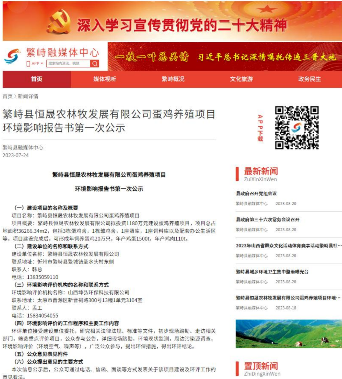
图 1 网上第一次环评信息公示

建设单位 2023 年 7 月 24 日在繁峙县融媒体中心网站上（ https://www.fsxrmtzx.com/#/details?infoId=33368 ）进行了首次公示，公告期限为 10 个工作日。网络公示情况见下图。